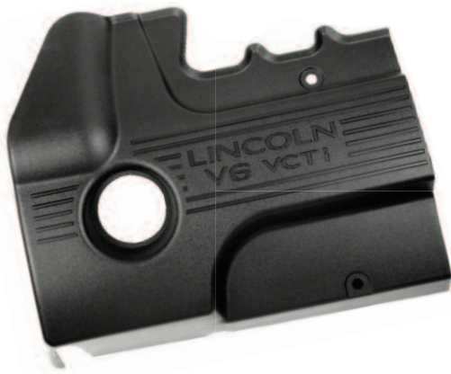
6 Cubierta del motor